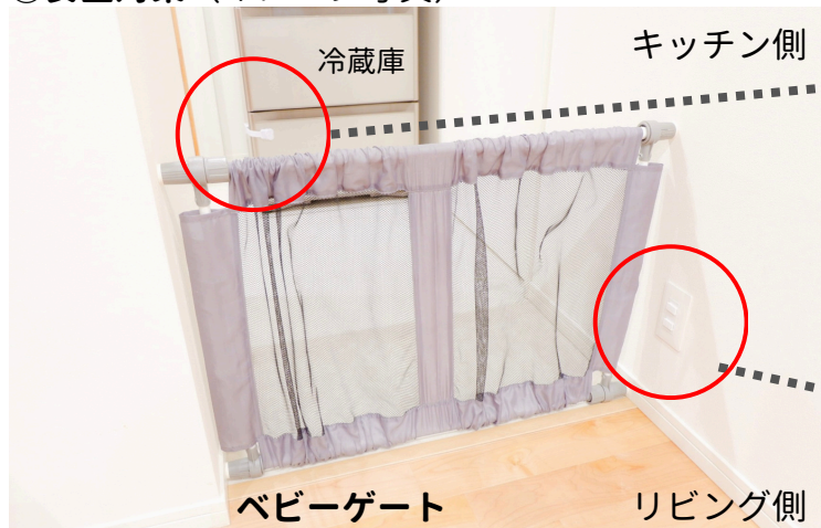
②安全対策（イメージ写真）