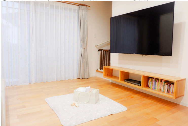
①リビング（日中のお世話イメージ写真）