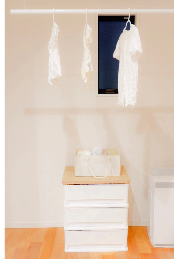
③干す→しまいがラク